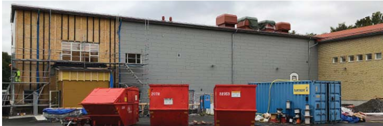
Lundenhallen - under uppbyggnad